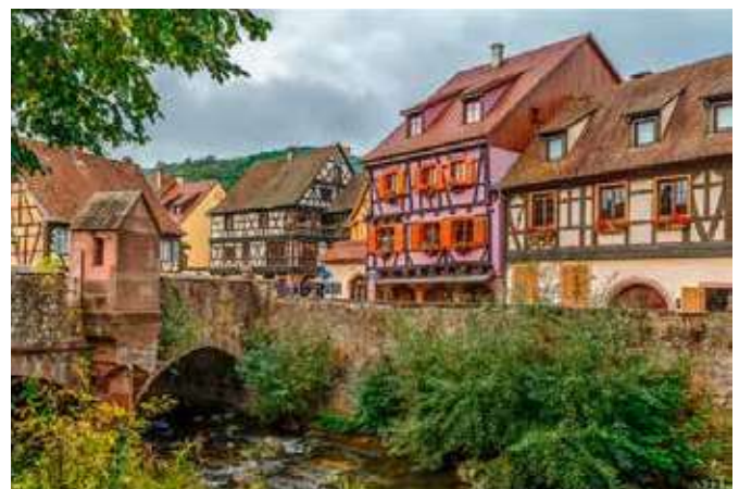
Kaysersberg in de Elzas